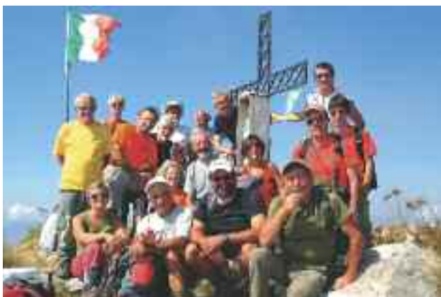
11 Settembre 2011: sul Toraggio