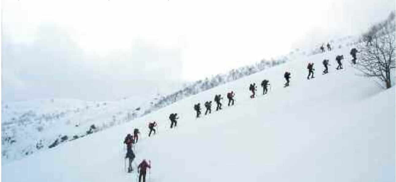
27 Marzo 2011: verso la Tomba di Matolda